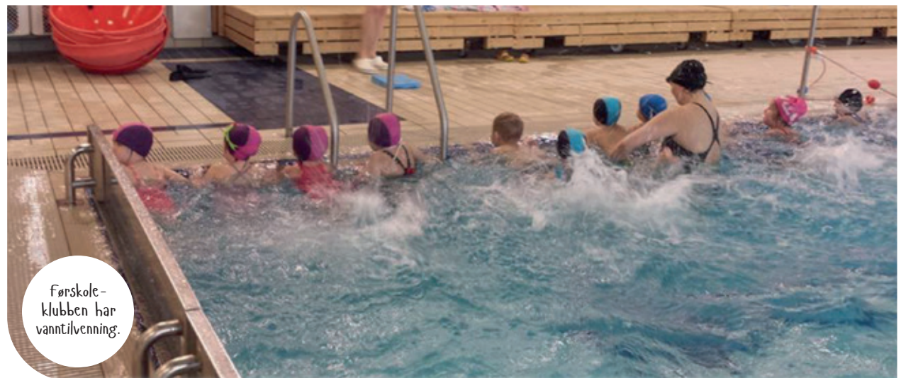
Førskole- klubben har vann-tilvenning.