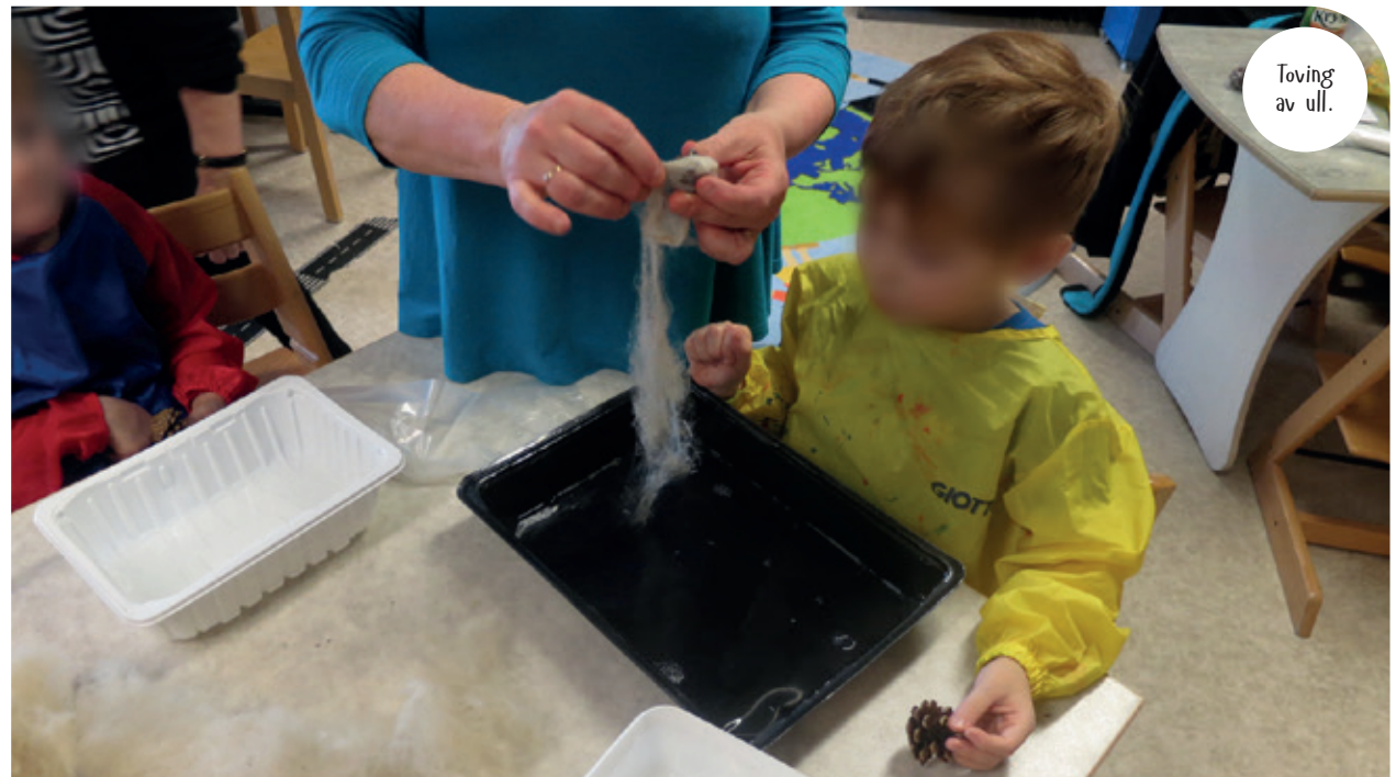
Toving av ull.

Med utgangspunkt i «Rammeplanen for barnehagens innhold og oppgaver» bidrar Trampoline til å skape et godt bindeledd mellom barnehage og skole.